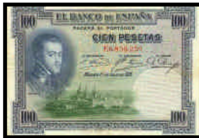
▲ Billete de 100 pesetas, del año 1925

www.fuenterrebollo.com webmaster@fuenterrebollo.com (más de 1.000 visitas diarias)