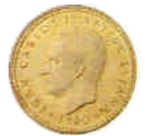
▲ 1980. Peseta del Rey ya con la democracia consolidada.