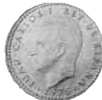
▲ 1975. Primera peseta del rey Juan Carlos con la vista dirigida hacia la izquierda.