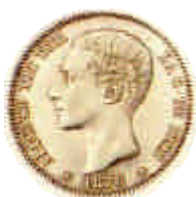
▲ 1876. Primera peseta de la Restauración con la efigie del rey Alfonso XII.