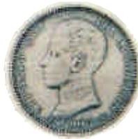
▲ 1903. Ya conseguida la mayoría de edad a los 16 años, Alfonso XIII posó de cadete.