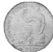
▲ 1934. Primera peseta de la República, acuñada a los tres años de proclamarse.