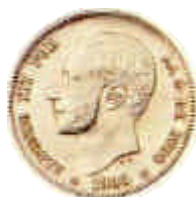
▲ 1885. La peseta de patillas, por las que lucía Alfonso II.