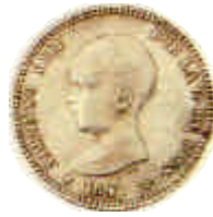
▲ 1891. Una peseta de Alfonso XIII de pelón cuando tenía dos años.