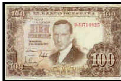
▲ Billete de 100 pesetas, del año 1953