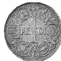
▲ 1944. Primera peseta de Franco, la del uno, todavía sin la efigie del general.