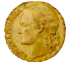
▲ 1937. El gracejo popular llamó rubia a esta peseta republicana en plena guerra civil.