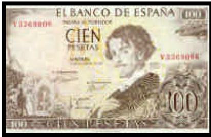
▲ Billete de 100 pesetas, del año 1965