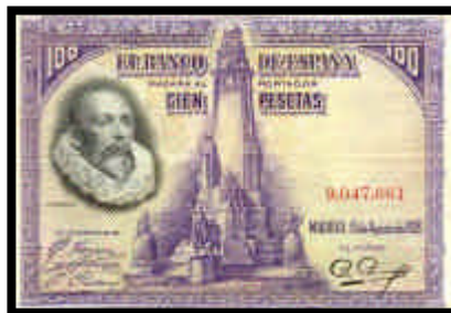
▲ Billete de 100 pesetas, del año 1928