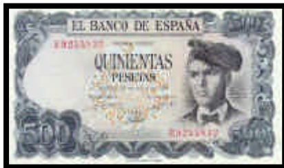
▲ Billete de 500 pesetas, del año 1971