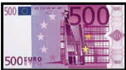
▲ Billete de 500 Euros, del año 2002