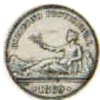
▲ Primera peseta oficial, acuñada por las autoridades revolucionarias de 1868.