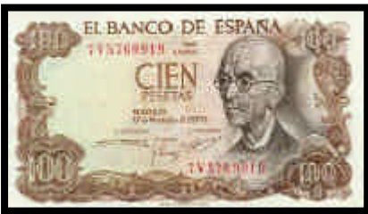
▲ Billete de 100 pesetas, del año 1970