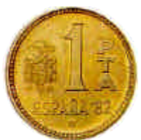
▲ 1980-1982. Última rubia, acuñada con motivo del Mundial de fútbol de España.