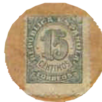
▲ 1937-1938. Discos de cartón que circularon en la guerra ante la escasez de metales.