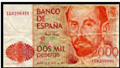
▲ Billete de 2000 pesetas, del año 1980