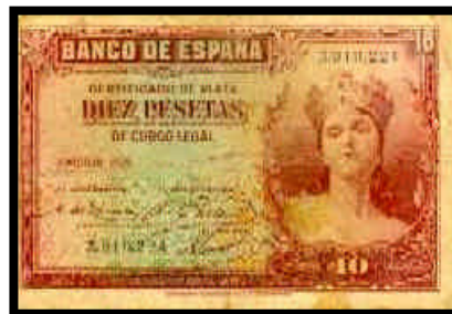
▲ Billete de 10 pesetas, del año 1935