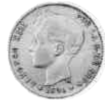
▲ 1896. A los 10 años, el Rey hacía gala de este tupé en las monedas de 1 pta.