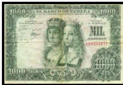
▲ Billete de 1000 pesetas, del año 1957