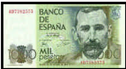
▲ Billete de 1.000 pesetas, del año 1979