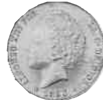
▲ 1893. Peseta de bucles, con el perfil de Alfonso XIII cuando tenía siete años.