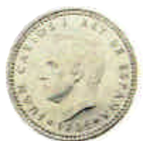
▲ 1982-1989. Peseta que recuperó el color blanco tradicional, aunque no la plata.