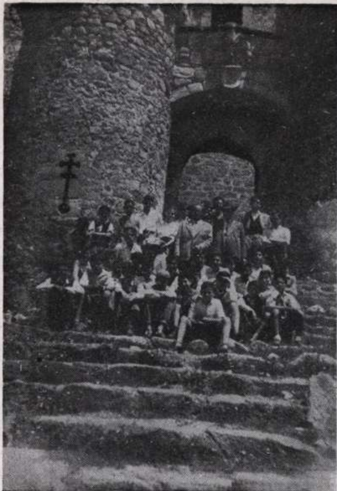
Alumnos de tercer curso en el Castillo de Manzanares el Real.